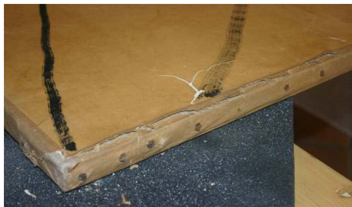
Ci-dessus : Détail montrant un décollage du papier de doublage par rapport à la toile et des déchirures.